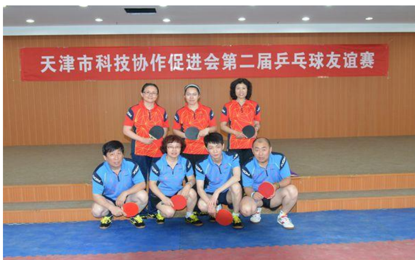
天津院、装备集团乒乓球联合代表队参加天津市科技协作促进会举办的第二届乒乓球友谊赛

为了充分发挥公司工会及团委的桥梁纽带作用，2015年，总部及各子公司组织开展了形式多样、丰富多彩的职工文体活动和劳动竞赛活动，包括“三八”妇女节的主题活动、“五四”青年节的健步走活动、纪念抗战胜利70周年为主题的参观纪念活动、强健体魄、激发活力的乒乓球、毽球比赛等。员工们在工作之余能够参与到这些有意义的活动中，不仅让公司生活更充实，也让大家体会到归属感，增强了员工们的凝聚力和向心力。