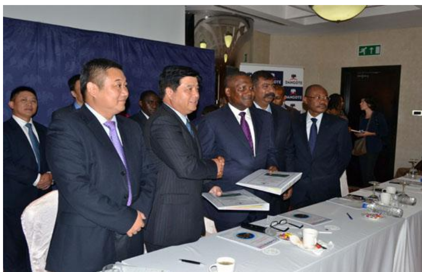
公司与Dangote集团签署合同总金额为14.87亿美元的一揽子项目合同

2015年，公司在传统市场成绩斐然。在非洲，公司与Dangote集团签订的价值14.87亿美元的合同，是继2008年签订18亿美元、2011年签订14.26亿美元合同之后，公司与Dangote的第三次大规模合作；在东南亚，公司与越南三家水泥公司签署了4条6000t/d水泥熟料生产线及年产200万吨粉磨站。而在新兴市场也颇有收获，在中亚，公司在哈萨克斯坦与吉尔吉斯斯坦共签订了2条3200t/d水泥熟料生产线。