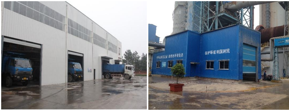
溧阳市水泥窑协同处置污泥项目

由中材国际投资、下属环境公司管理运营的溧阳市水泥窑协同处置生活垃圾示范线项目运转情况良好，共处置溧阳市市政污泥、一般工业污泥、其他固体废弃物合计 35723.5 吨。此项目每年可节约填埋用地约 25 亩、减少 CO2 排放约 28000t，彻底解决了溧阳市生活垃圾的处理难题，实现了溧阳市生活垃圾日产日清的目标要求。