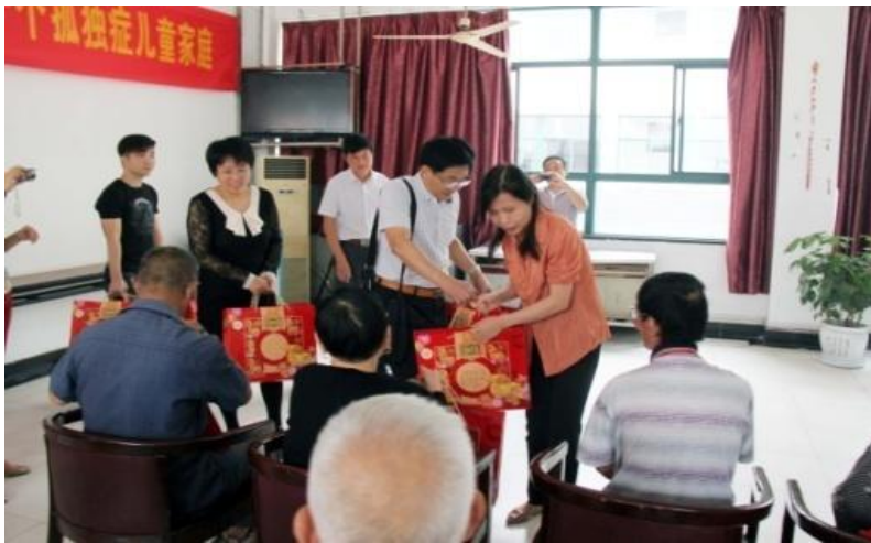
公司领导前往百家湖敬老院看望慰问孤寡老人

此外，公司积极推行办公节能措施，用电用水做到使用即开、不用即停，培育节能的良好习惯；积极应用节能技术，办公区使用节水节能型器具，减少能源消耗；充分利用 OA 协同办公平台、企业内部邮箱等文件传递渠道，逐步向无纸化办公迈进；大量采用视频会议形式召开会议，提供快捷高效的沟通新途径，从而有效地降低公司的运营成本，提高工作效率，并积极参与南京市“保护母亲河行动”等环保公益活动。