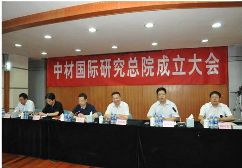
2015年8月28日，召开中材国际研究总院在津全体员工大会

2015年，公司共开展了科研开发项目共146项，正在执行的国家级科研项目6项，申请专利68项，获得专利授权54项。