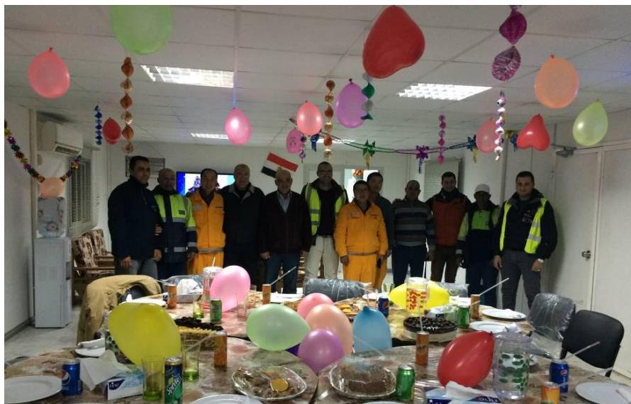
2015 年中国新年互动活动

项目部还通过多种方式加强与业主、咨询公司和当地分包商的沟通,增进彼此的信任 and 了解。项目部在春节、中秋等中国的传统节日期间,邀请各方代表参加项目部组织的节日活动,宣传中国的传统习俗;同时当地的重大节日,如开斋节、宰牲节等期间,邀请中方管理人员参与当地的传统节日聚会。通过这些交流活动,有效的加深了双方的了解,创造了良好的合作氛围。